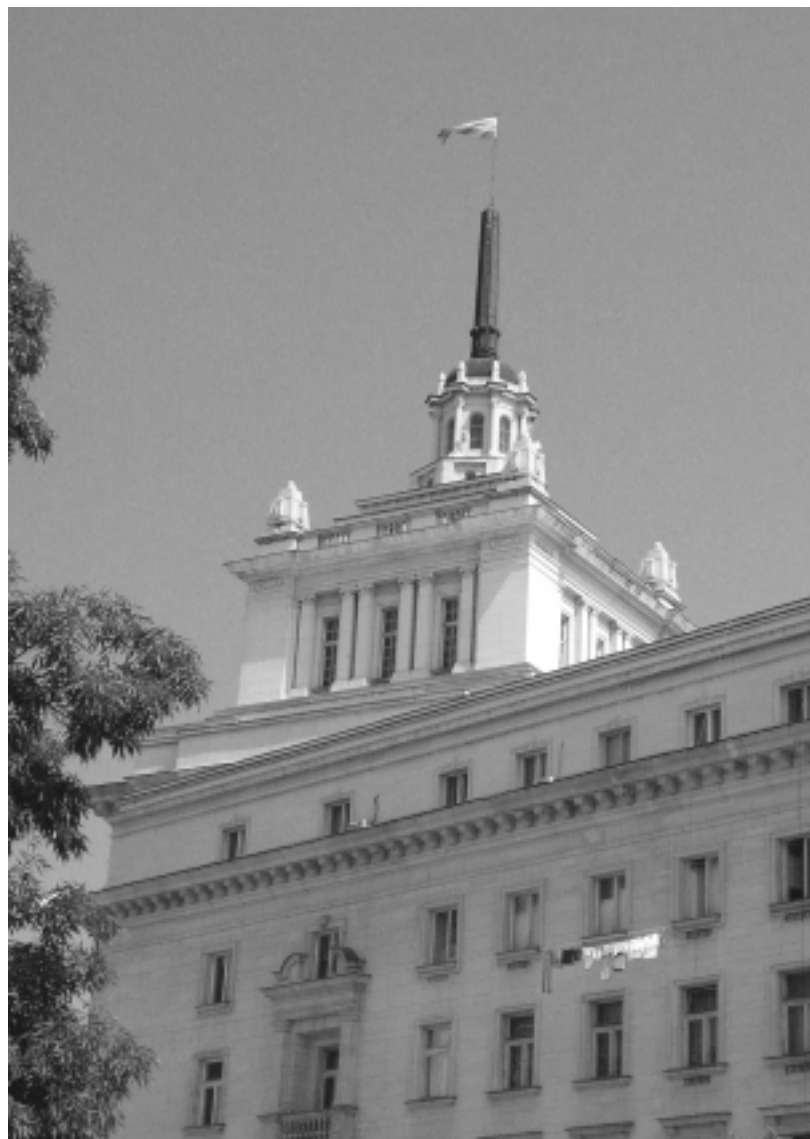
Лъчезар Бояджиев. Пране, 2003 (от серията Визуални нередности) Luchezar Boyadjiev. Laundry, 2003 (from the cycle Visual Irregularities)