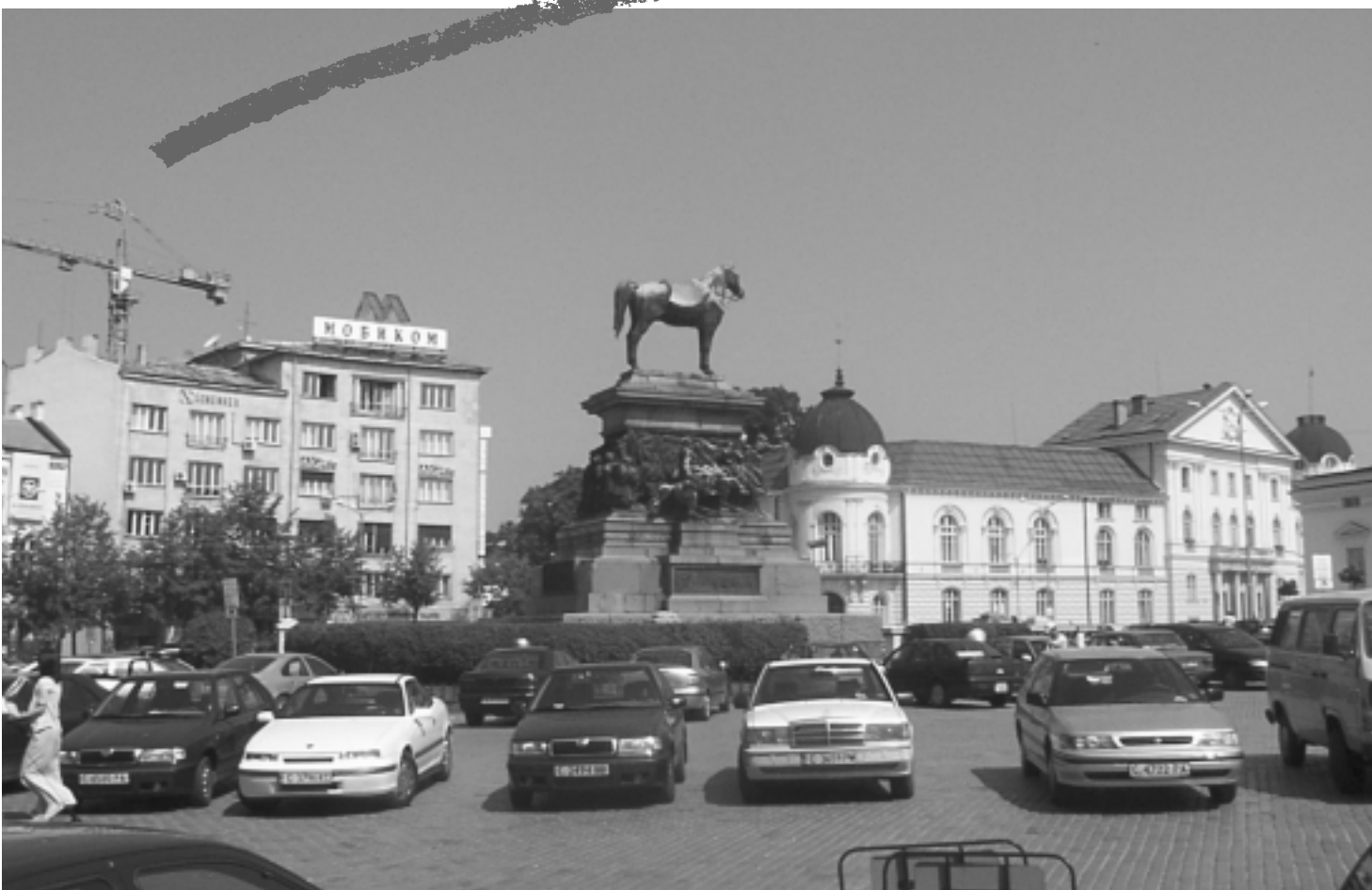
Лъчезар Бояджиев. Мискините пак окрадоха метала, аман!, 2003 (от серията Визуални нередности) Luchezar Boyadjiev. The scoundrels stole the metal again, we've had it!, 2003 (from the cycle Visual Irregularities)