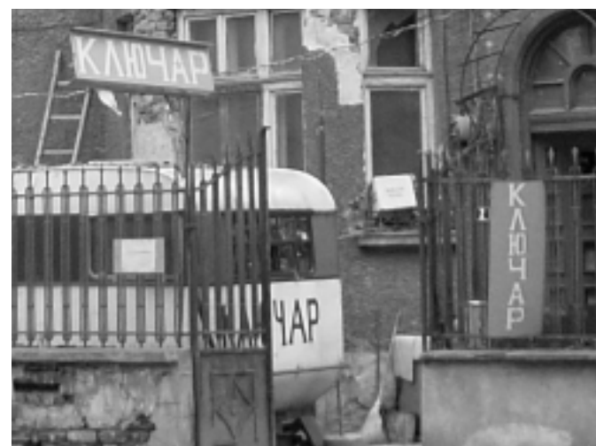
Работният офис на моя махленски ключар My neighborhood key maker's "office" of operations

How would you know this is the emergency health care hospital Institute "Pirogov" and not a Phillips shop or my neighborhood key maker's "office"? Both corporate and neighborhood business should have equal rights to advertisement and a fare chance for prosperity in this city